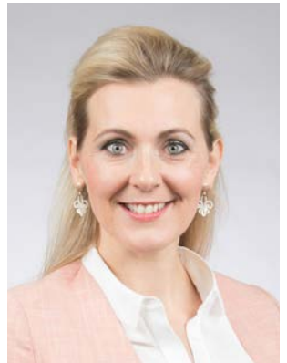
Bundesministerin Mag. (FH) Christine Aschbacher